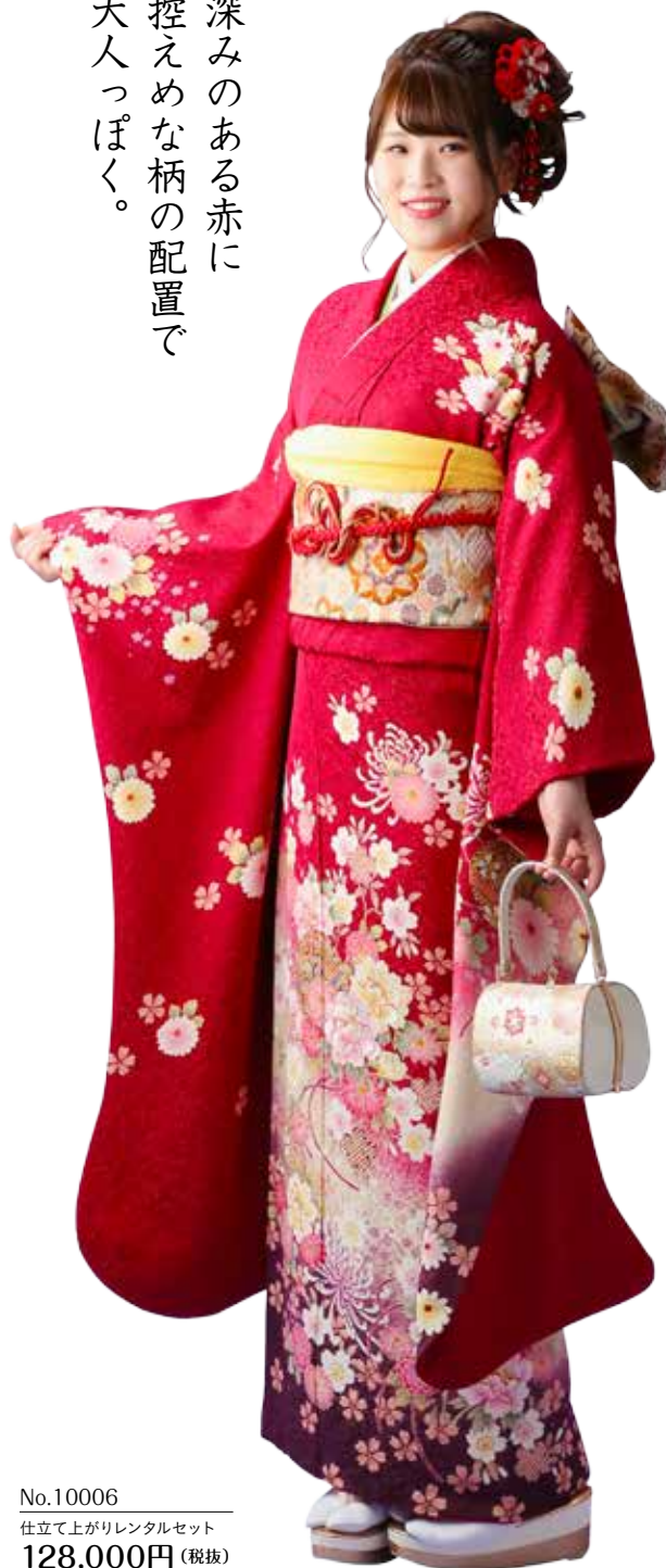
No.10006 仕立て上がりレンタルセット 128,000円 (税抜)