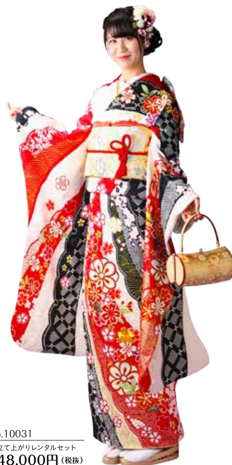
No.10031 仕立て上がりレンタルセット 148,000円 (税抜)