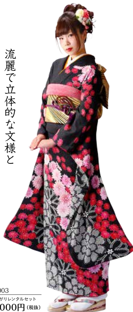
No.10003 仕立て上がりレンタルセット 148,000円 (税抜)