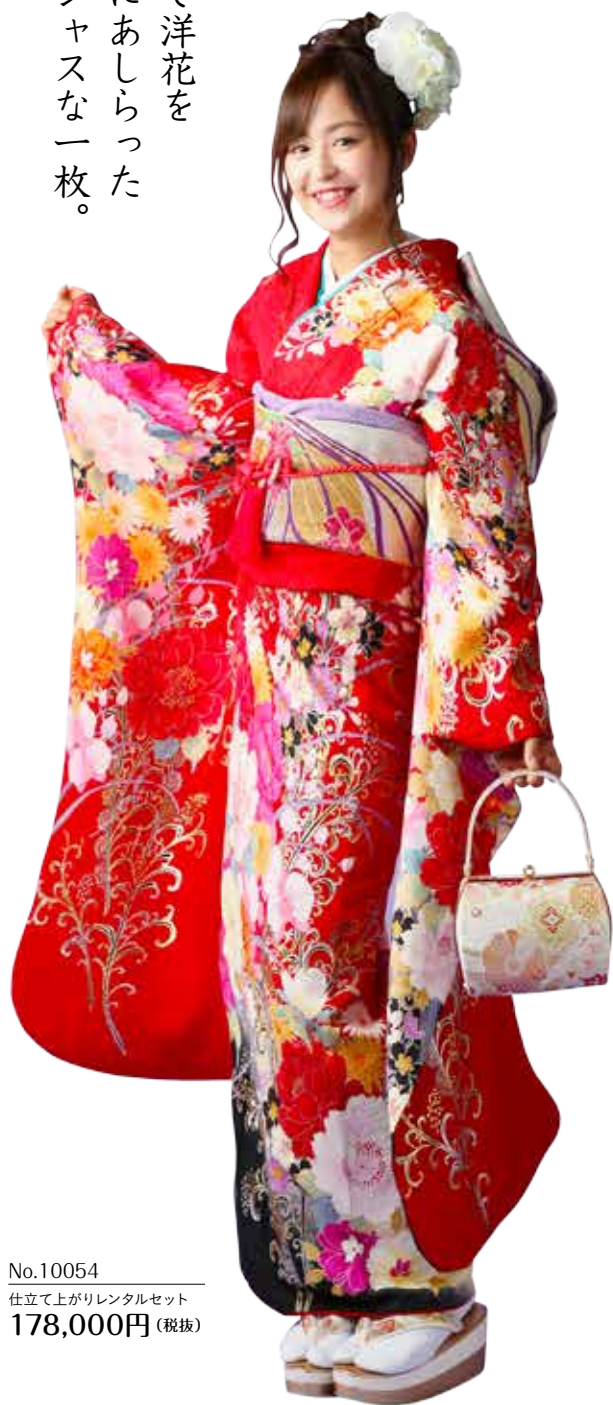
No.10054 仕立て上がりレンタルセット 178,000円 (税抜)