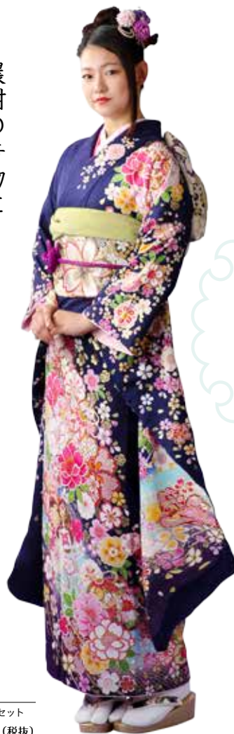
No.10053 仕立て上がりレンタルセット 198,000円 (税抜)