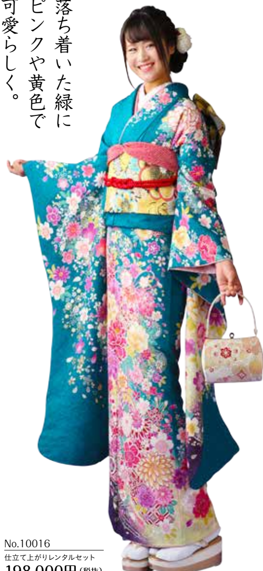
No.10016 仕立て上がりレンタルセット 198,000円 (税抜)