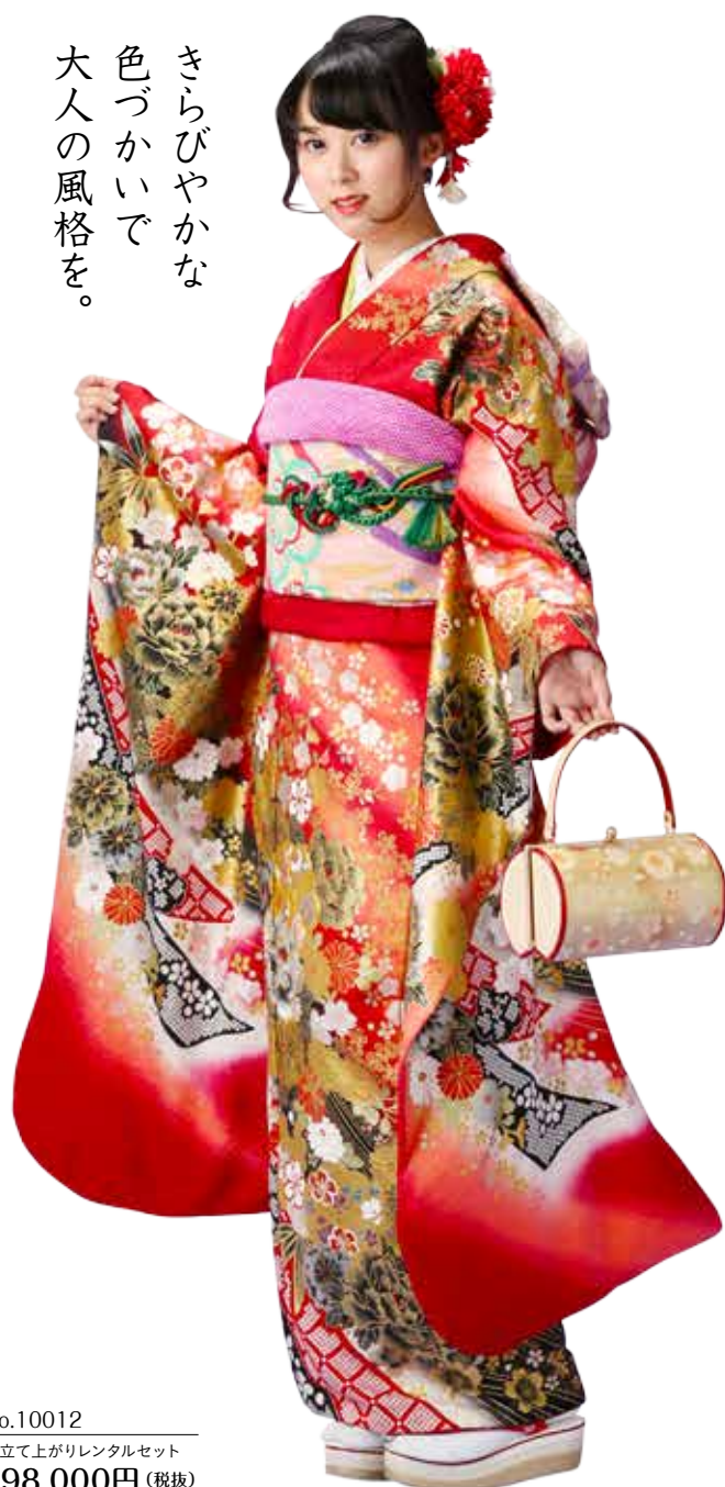
No.10012 仕立て上がりレンタルセット 198,000円 (税抜)