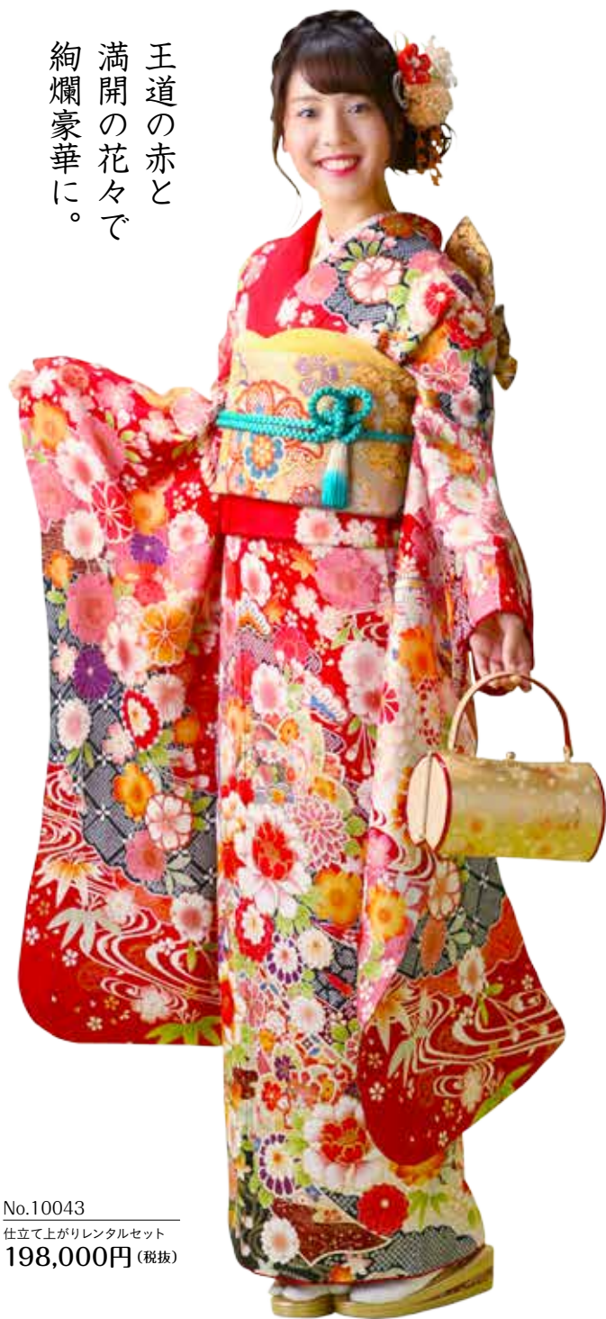
No.10043 仕立て上がりレンタルセット 198,000円 (税抜)