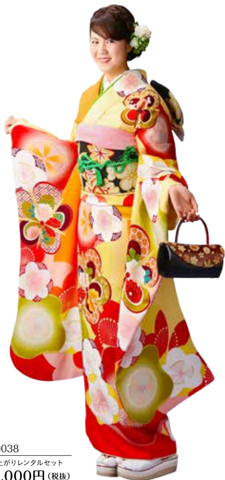
No.10038 仕立て上がりレンタルセット 198,000円 (税抜)