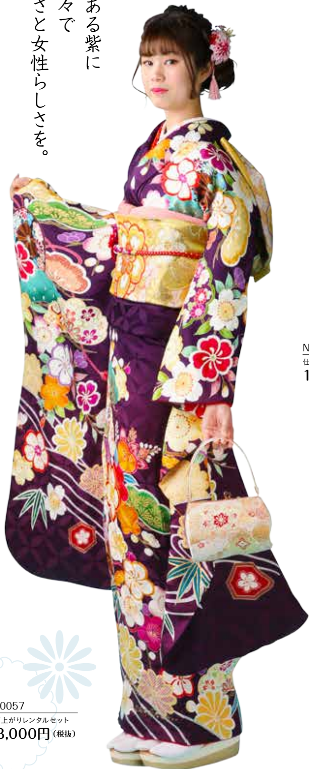
No.10057 仕立て上がりレンタルセット 218,000円 (税抜)