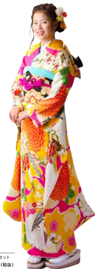
No.10052 仕立て上がりレンタルセット 218,000円 (税抜)