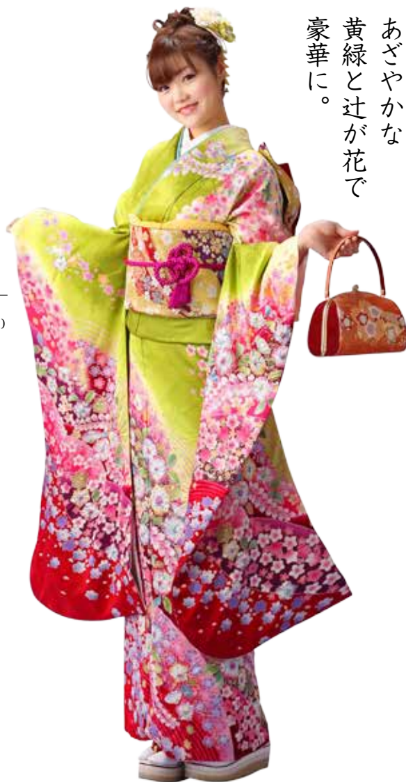
No.10042 仕立て上がりレンタルセット 198,000円 (税抜)