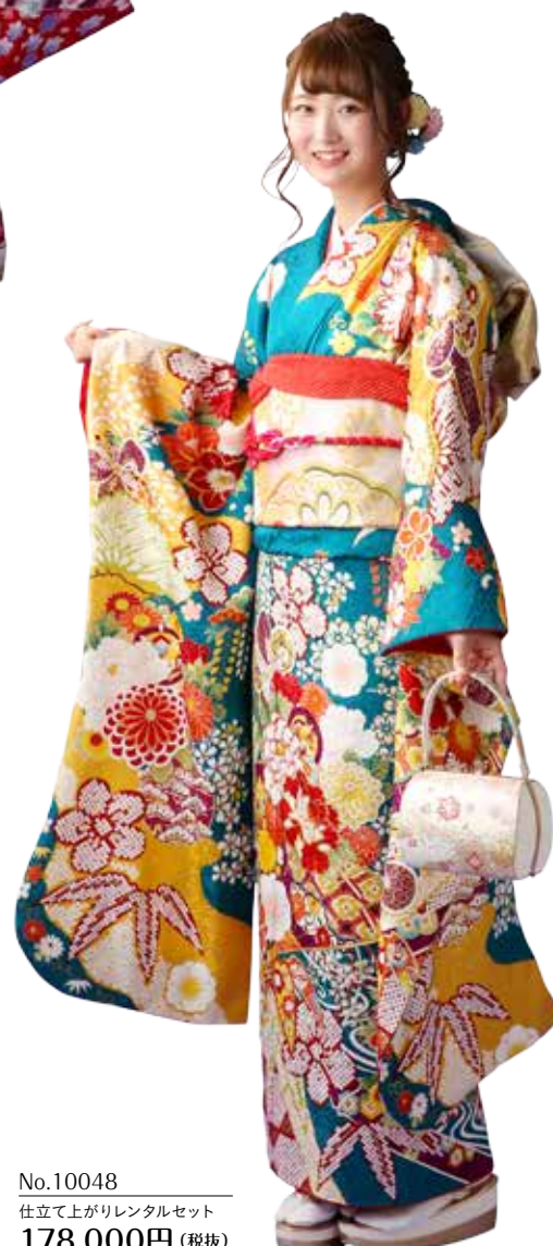
No.10048 仕立て上がりレンタルセット 178,000円 (税抜)