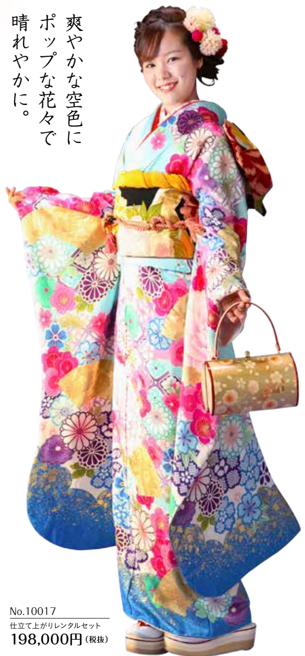
No.10017 仕立て上がりレンタルセット 198,000円 (税抜)