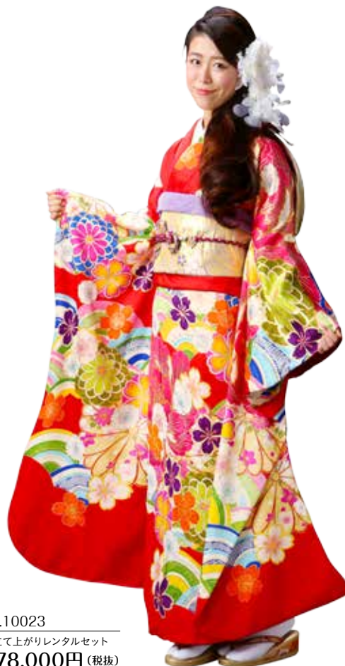
No.10023 仕立て上がりレンタルセット 278,000円 (税抜)