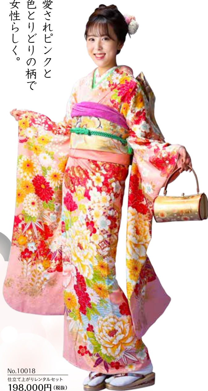
No.10018 仕立て上がりレンタルセット 198,000円 (税抜)