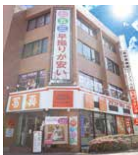
蔵前通り、柴又街道交差点角