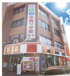
駐車場4台(お店の下)