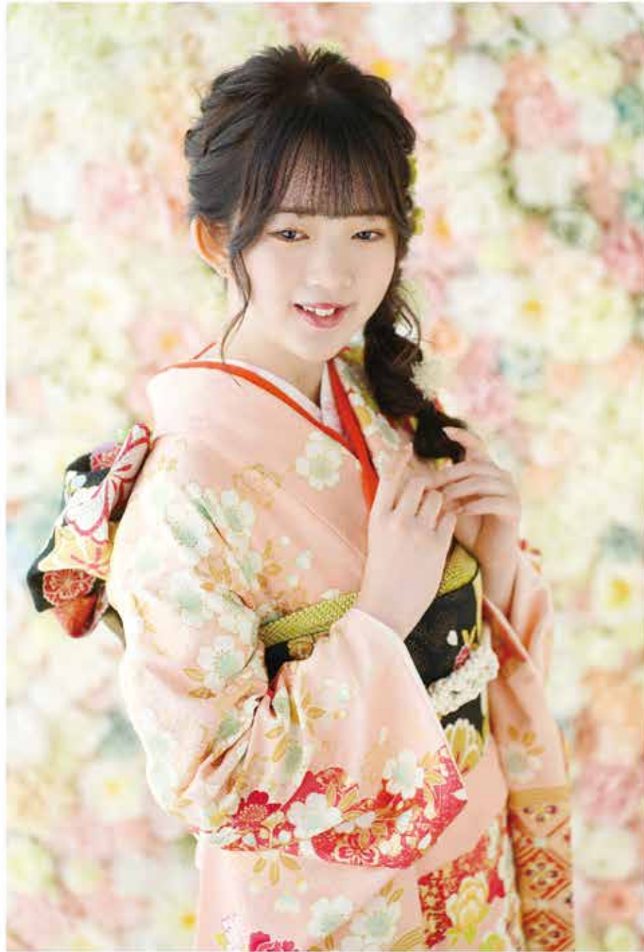
No.10018 仕立て上がりレンタルセット ¥198,000/税込 ¥217,800